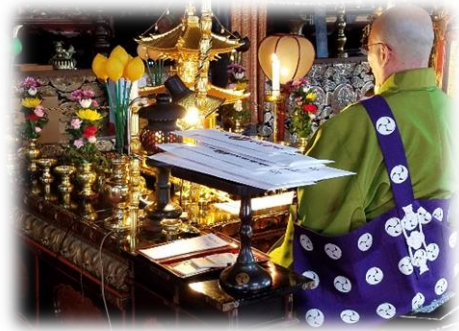
絵馬形の乗車券は水間寺にてご祈禱を受けております。