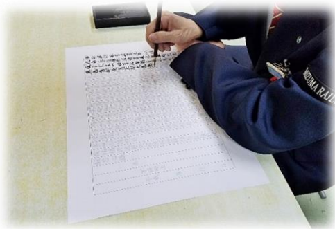
写経受講後、職場で練習する駅係員